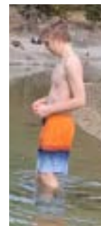
De Marvin isch leider untergange...