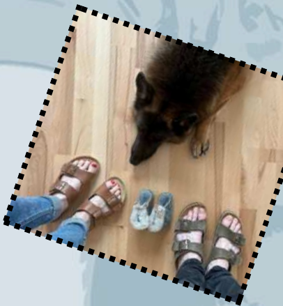
BFS Halle Mittwoch 20 Uhr